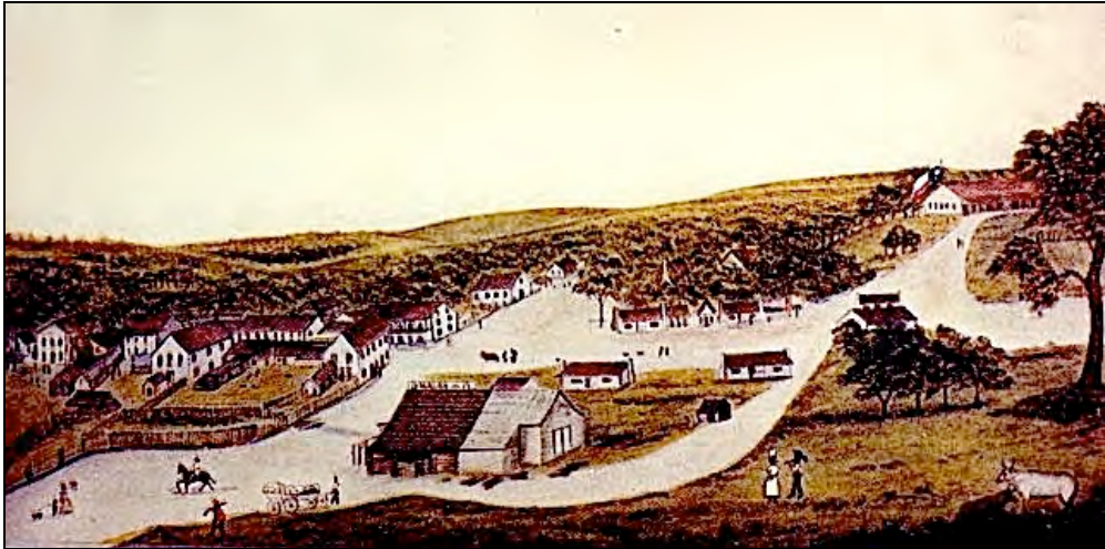
Austin dans les années 1840. (History Center, Austin Public Library, Austin, Texas)

(Adaptation en français par Serge Noirsain de la version publiée dans le vol. 68 d'octobre 1964 du Southwestern Historical Quarterly )