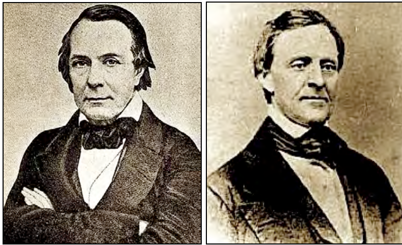
Mirabeau Lamar, président du Texas de 1836 à 1838 - James Hamilton Jr.

Le président texan en fonction, Mirabeau Lamar, et le diplomate James Hamilton Jr ont la conviction que leurs produits agricoles et leurs ressources cotonnières attireront des États européens. Né en Caroline du Sud, James Hamilton Jr (1780-1857) en a été le gouverneur en 1830. Le président Lamar lui a offert un commandement dans son armée en récompense de son dynamisme dans l'indépendance du Texas. Hamilton déclina l'offre, mais proposa ses services pour négocier un prêt à l'étranger. L'appareil politique texan comprend que la reconnaissance diplomatique de sa république est la condition préalable à la négociation d'un prêt à l'étranger et à l'implémentation de futurs contrats commerciaux. En juin 1837, le Congrès texan désigne J. Pinckney Henderson pour représenter leur État en Grande-Bretagne et en France 2 .