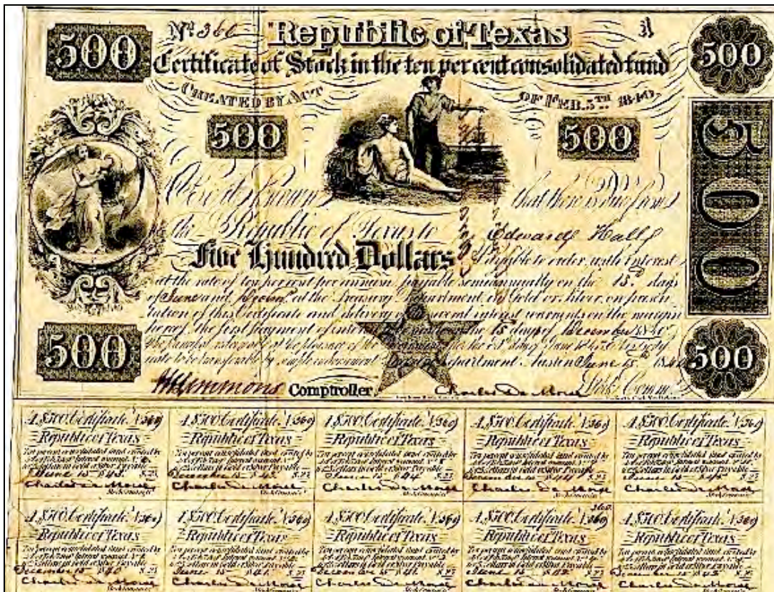
Bon de l'État du Texas sur son coton, 1840.