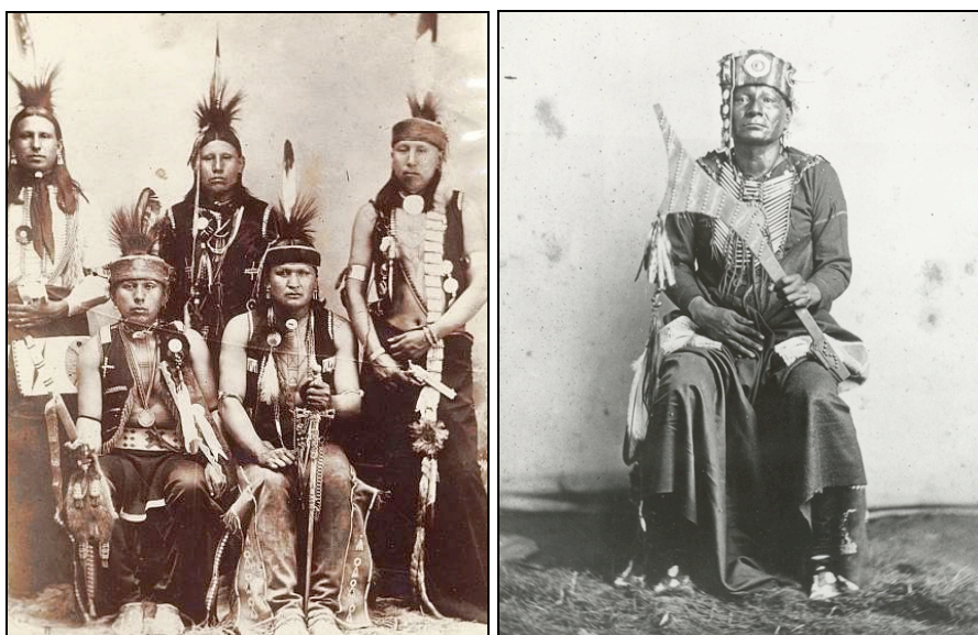
Guerriers Osages dans les années 1860-1880.

Après avoir franchi un large ravin flanqué d'arbres et de buissons épais, le colonel arrête ses hommes sur une éminence pour prendre un peu de repos et nourrir leurs chevaux et les mules qui transportaient leur matériel et leurs vivres. Les officiers se ruent en selle lorsque l'un d'eux signale un forte bande de cavaliers qui paraît les prendre en chasse. Il s'agissait d'environ 150 Indiens non encore identifiés. Était-ce des amis ou des ennemis ? Leur mission leur interdisant de livrer bataille en cours de route, ne fût-ce qu'en raison du nombre de ceux qui les traquaient, les Confédérés repartent au galop. Plus frais, les mustangs indiens gagnent progressivement du terrain et, bientôt, les deux partis se trouvent à portée de pistolet. Sachant qu'il est difficile d'ajuster son tir sur un cheval au galop, les officiers pressent l'allure sans dégainer leurs armes. Les Indiens ouvrent le feu les premiers et leurs balles frôlent leurs cibles : des guerriers osages ralliés à l'Union.