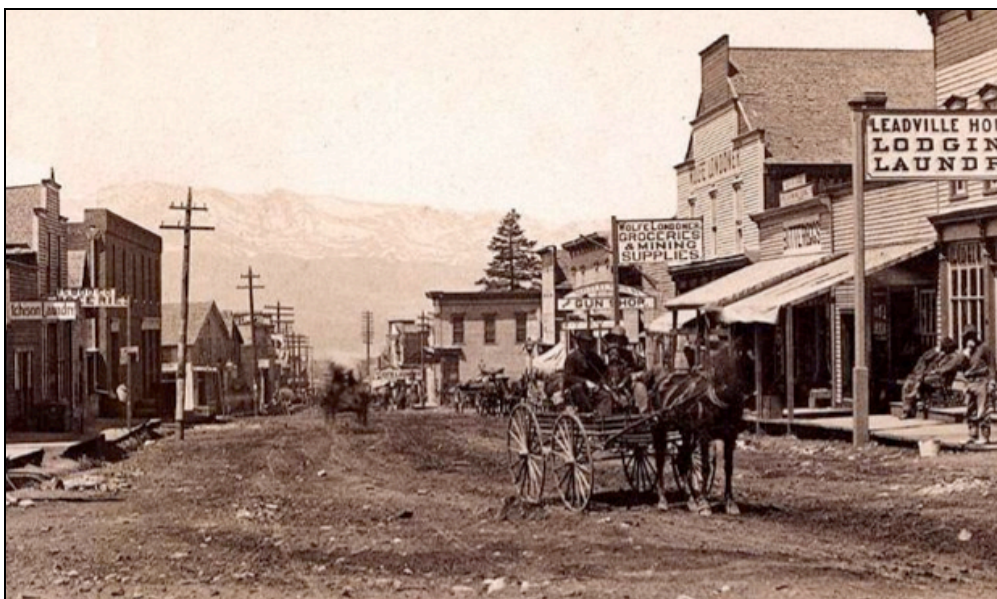
Denver en 1860.