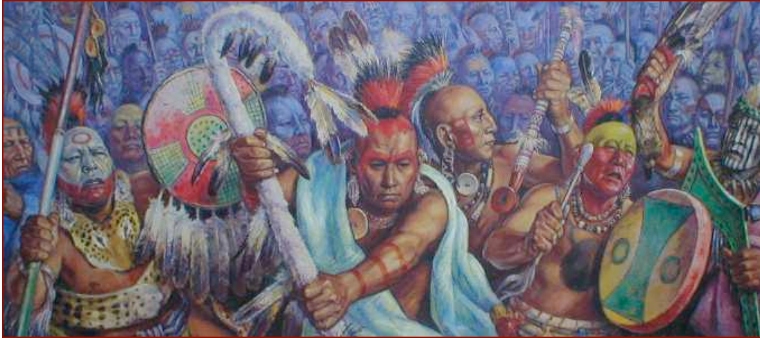
Charles Banks Wilson's Color Lithograph: « Osage Dream ». http://www.janaiae.com/gallerysouthwest/Osage%20Dreams.jpg

Les Osages appartiennent au groupe linguistique des Siouans. Sous la pression des tribus iroquoises, ils émigrèrent dans la région comprenant les Etats de l'Arkansas, du Missouri, du Kansas puis se fixèrent en Oklahoma au cours de la première moitié du XVII e siècle. Ils entament une longue guerre avec les premiers Cherokees qui s'installent en Oklahoma après avoir été expulsés de leurs terres dans l'Est. Le gouvernement américain ne s'était pas trop soucié de savoir si cela plairait ou non aux Osages de devoir céder une partie de leur domaine territorial aux Indiens dont les gouverneurs des Etats du Mississippi, de l'Alabama, de la Géorgie et du Tennessee briguaient les terres, avec la bénédiction du président Andrew Jackson. (Voir sur ce site, notre article Expulsion des Cherokees, Choctaws, Chickasaws et Creeks dans l'Ouest. )