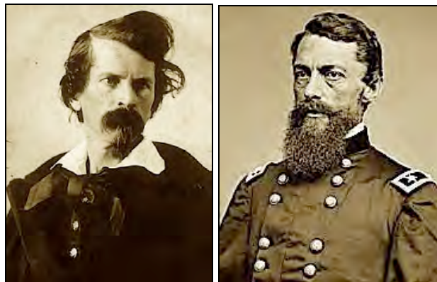
Earl Van Dorn - George Stoneman.