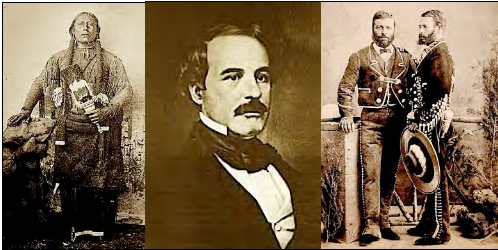
Comanche krijger. - R.E. Lee, 1855. Mexicaanse « Cortinistas », 1855-1865.

In december 1855 overtuigt de minister van Defensie, Jefferson Davis het Congres en president Franklin Pierce om het nodige krediet ter beschikking te stellen voor de organisatie van twee cavalerieregimenten om groepen Comanches, Kiowa's en Apachen te pacificeren die een ravage aanrichten aan de rand van Texas en in het oosten van Kansas. Tot nu toe bestonden de bereden troepen van het Amerikaanse leger uit twee regimenten van dragonders en één regiment van riflemen (infanterie te paard). In navolging van de oude Franse dragonders zijn deze drie regimenten getraind en bewapend om te voet te vechten. Naast enkele kleine verschilpunten inzake hun uniform en toebehoren (zoals bijvoorbeeld de Hardee hoed, die de troepen verfoeiden), is het vooral hun bewapening die deze twee regimenten doet verschillen van de drie andere bereden regimenten van het Amerikaanse leger. Vijf van de escaders van de 2 d Cavalry stellen zich tevreden met de Springfield M. 1855, een geweer met getrokken loop, dat voor een cavalerist echter het zware nadeel heeft dat het een voorlader is. De vijf andere bekomen het geweer met getrokken loop Perry dat een achterlader is. Natuurlijk zijn ze allemaal voorzien van een sabel en colt van het kaliber 44 of 36, al naar gelang het eskader. De 1 st Cavalry wordt in twee contingenten gesplitst, het ene verbonden aan Fort Arbuckle, en het andere aan Fort Washita op het territorium van de indianen (het toekomstige Oklahoma).