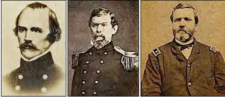
Albert S. Johnston - William G. Hardee - George H. Thomas.