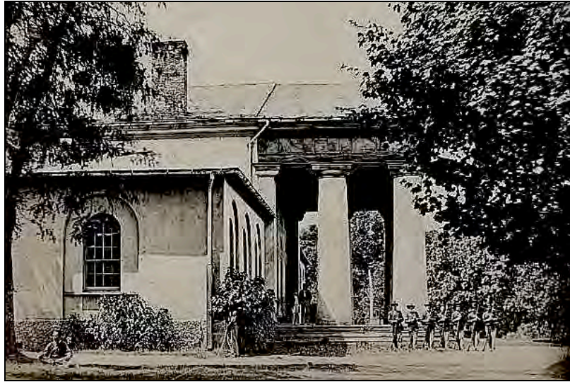
R.E. Lee huis te Richmond 1861-1865.