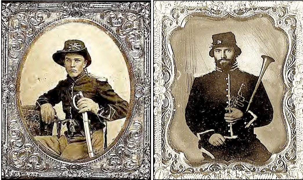
2 d U.S. Cavalry, 1855-1860, ruiter en muzikant.