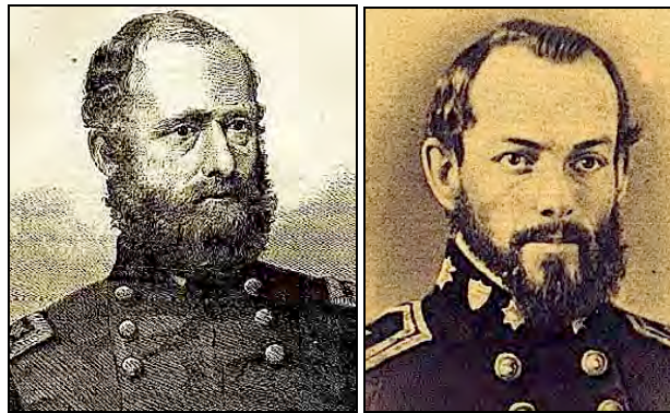
Kenner Garrard - Edmund Kirby Smith.