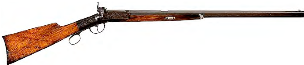
Perry percussie karabijn .54 kaliber.