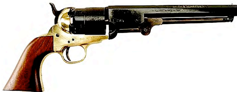
Colt 1851 van het kaliber 44.