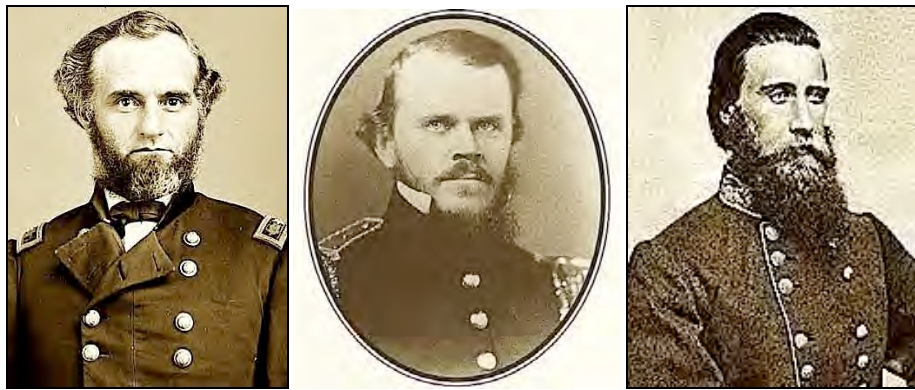
Richard W. Johnson - Nathan G. Evans - John B. Hood.