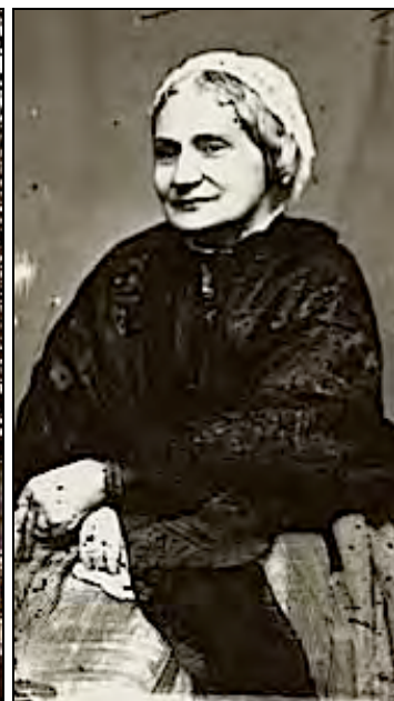
Custis-Lee Mansion te Arlington. Mary Custis Lee, 1868.