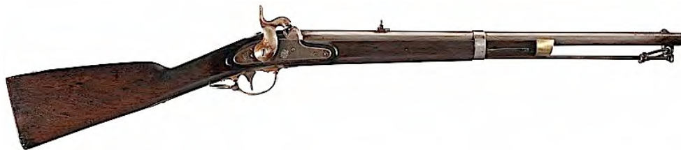
Gestreepte karabijn Springfield, M. 1855.