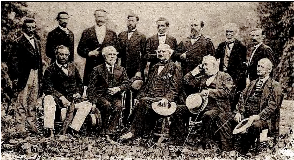
General Lee and his confederate officers at White Sulphur Springs, West Virginia, in August 1869. This is the only from life photograph of Lee with his generals in existence, during the war or after.

Als we al dit in aanmerking nemen, kunnen we ons er dan echt over verwonderen als de verenigingen van zwarten in Richmond (Virginia) nog in 1999 de racistische meningen van R.E. Lee onderstrepen en zich verzetten tegen de affichering van zijn portret op een publieke plaats in de stad? Als antwoord op hun initiatief organiseerden de handlangers van de K.K.K en hun vrienden van de Sons of Confederate Veterans een tegenbetoging voor het stadhuis van Richmond om het portret van hun icoon op te dringen 8 .