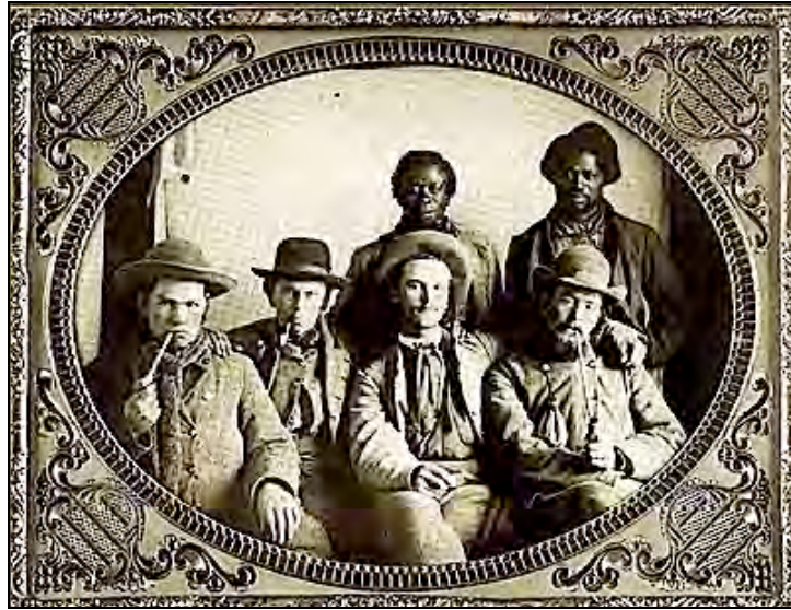
Soldaten van de 7 e Tennessee Cavalry met twee van hun slaven.