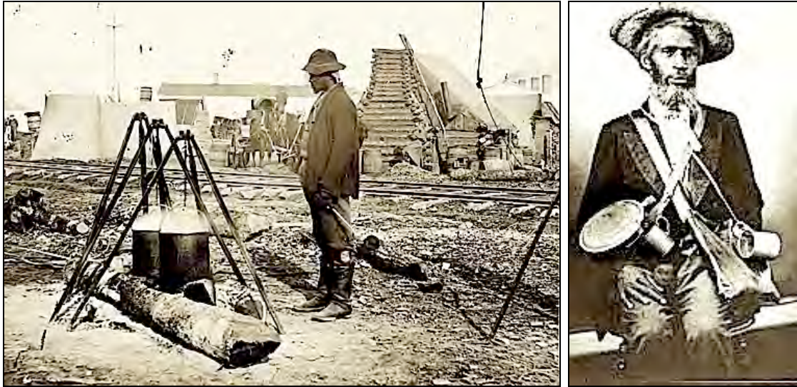
Twee zwarte Confederate “warriors”: links, in een kamp in Centreville (Va), 1862. Rechts : zwarte confederate “warrior” klaar om de Yankees te bestrijden.

Zwarte “soldaten” van de Confederatie : altijd met een schop, een houweel of pakketten, maar nooit met een wapen. In de Zuid, werd het verboden om zwarten om een wapen te dragen.