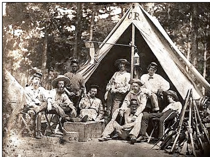
Links, vermeende zwarte soldaat, 5 e Georgia Infantry in 1862.